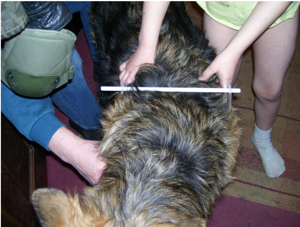
Table de mesure

Voici notre modèle réticent, qui vous montre comment le faire, en ce qui concerne la largeur. Il a fallu trois (et demi) de nous pour obtenir cette photo! Donc, je sais ce que cela signifie!